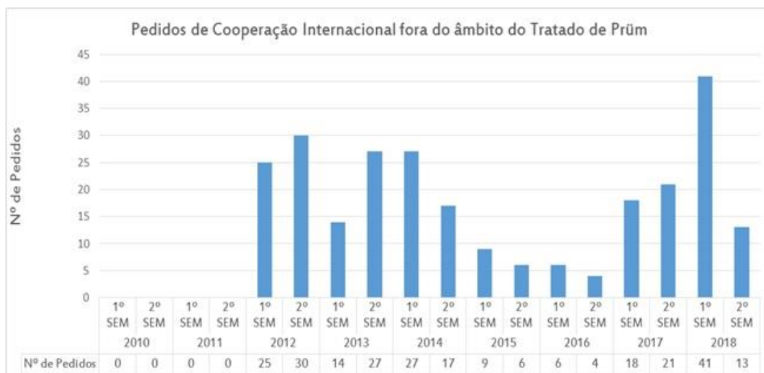
Quadro 7 - Cooperação internacional fora do âmbito do Tratado de Prüm