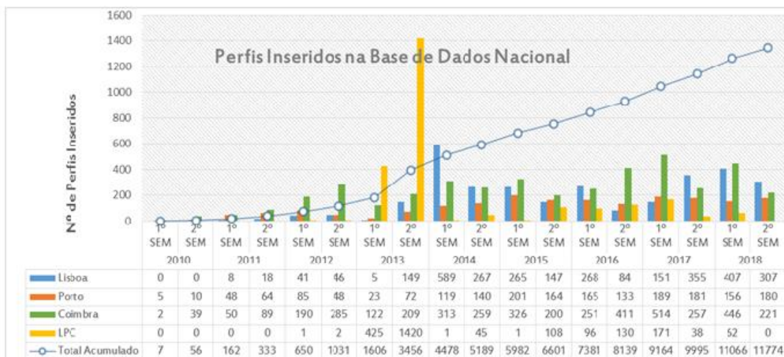
Quadro 2 - Perfis de ADN inseridos por categoria